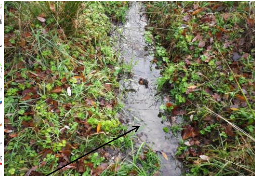
Localisation et vu du ru de la Matrassière.