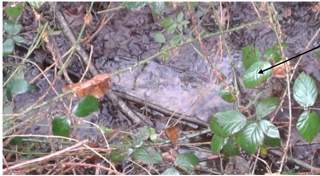
Localisation et vue du ru du Tertre Rouge