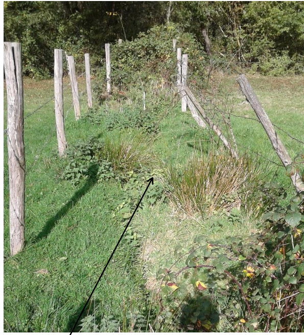
localisation et vue du fossé du Chaillou