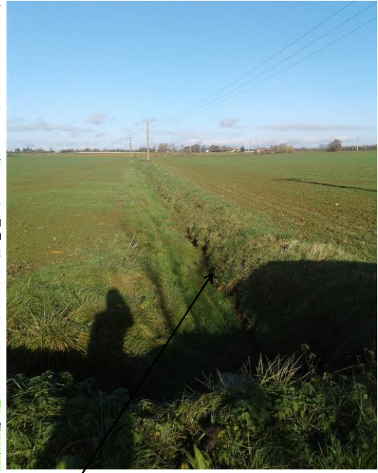
Localisation et vue du fossé de Chanteloup