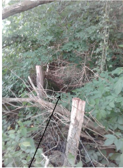
Localisation et vue du fossé de Huchepie