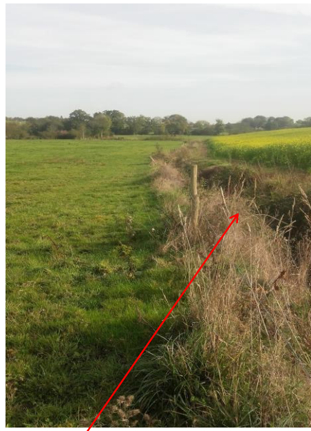
Localisation et vue du fossé de la Provostière