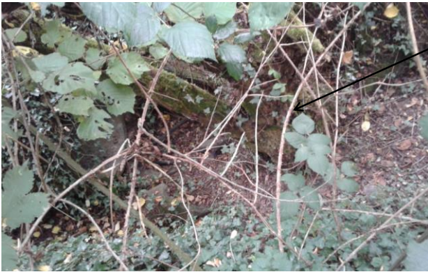
Localisation et vue du fossé du Grand Mohaison