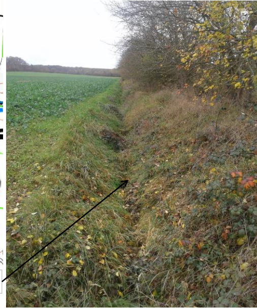
Localisation et vue du fossé de Saint-Michel