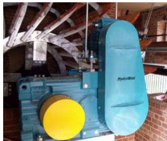
Exemples de roue moderne