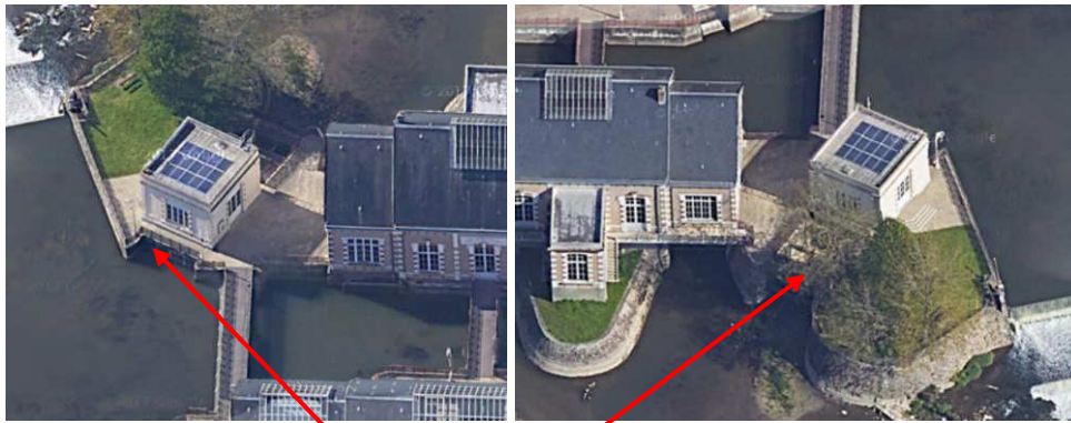
Futur emplacement de la passe à poissons