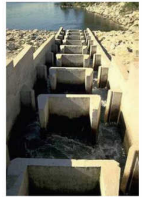
Exemple de passe à fentes