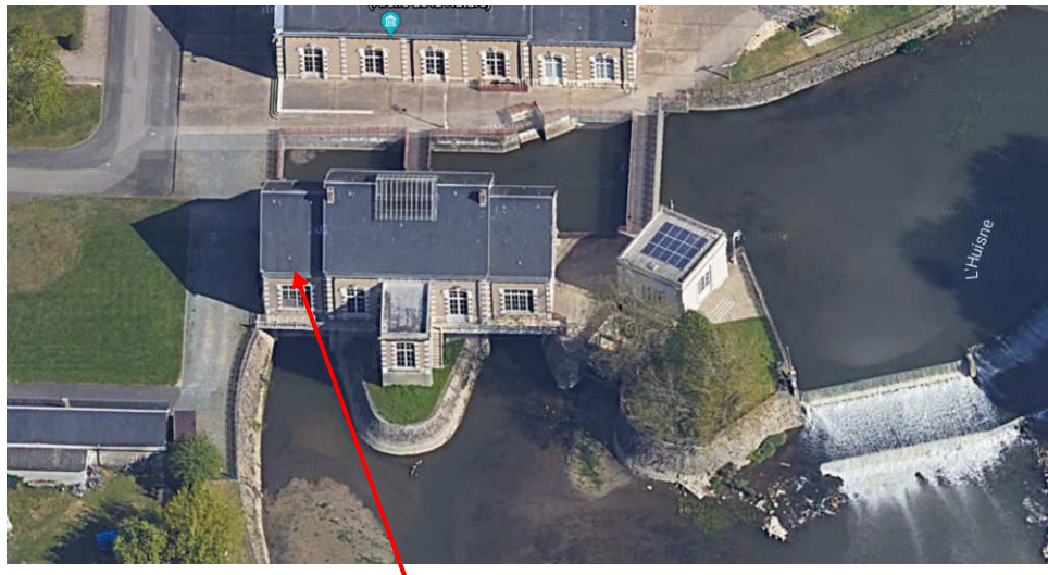
à la place de la roue à aubes hors d'usage