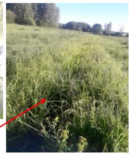
Localisation et vues de l'écoulement de Bois Rabeau