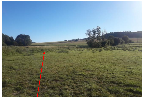
Localisation et vue de l'écoulement de Bois Rabeau