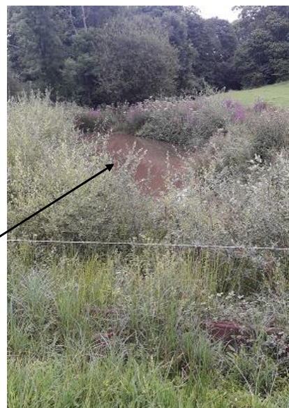
Localisation et vue du tronçon expertisé