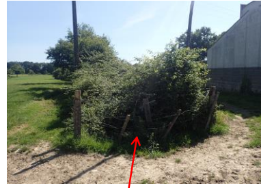
Localisation et vue du tronçon de la Brémancière