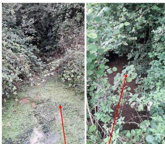
Localisation et vue de l'écoulement de la Buchaille