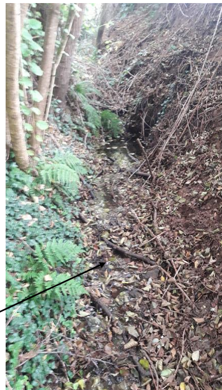
Localisation et vue des tronçons expertisés