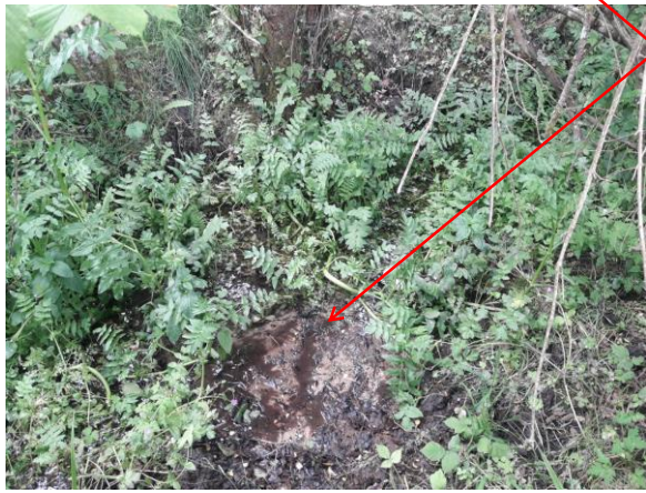
Localisation et vue du ru des Champanières