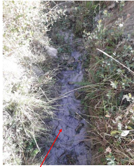
Localisation et vue de l'écoulement de Courtigaults