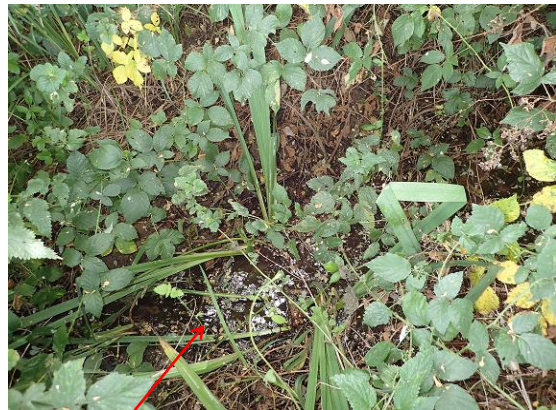
Localisation et vue du tronçon de la Grande Baumerie