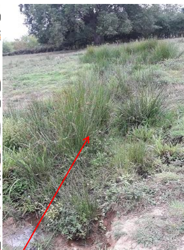
Localisation et vu de l'écoulement de la Grande maison