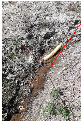
Localisation et vues des sources du ru de la Mohardière