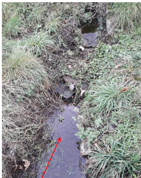
Localisation et vue du ru du Mortray