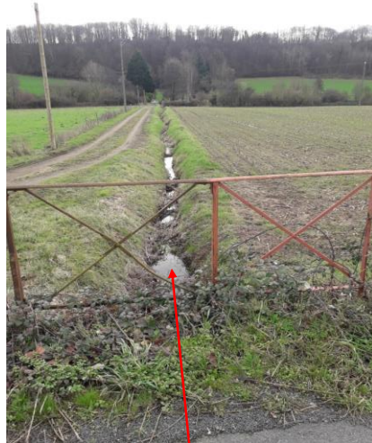
Localisation et vue de l'écoulement de l'oraisière