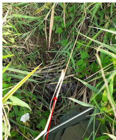
Localisation et vue du tracé réel du cours d'eau