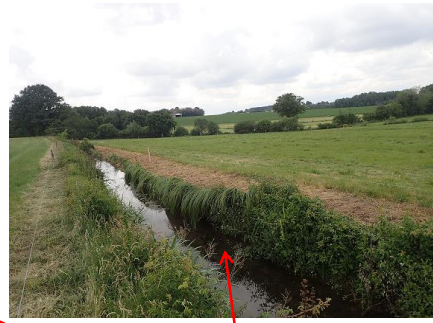
Localisation et vue du tronçon de la Petite Beurelière