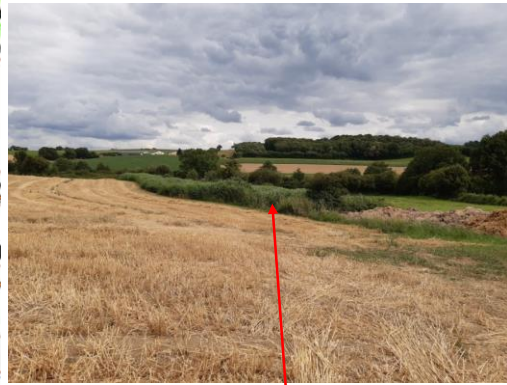
Localisation et vue du ru de la Petite Guichardière