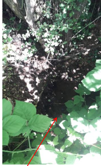
Localisation et vue du tronçon du Rençon