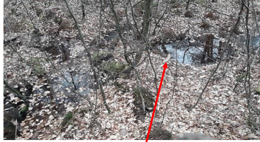
Localisation et vue de la source de la Vallée Layée