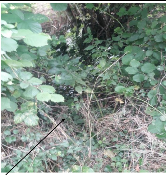
Localisation et vue de l'écoulement expertisé