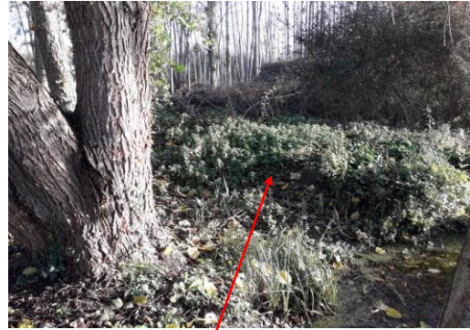
Localisation et vue du tronçon des Belles Ouvrières