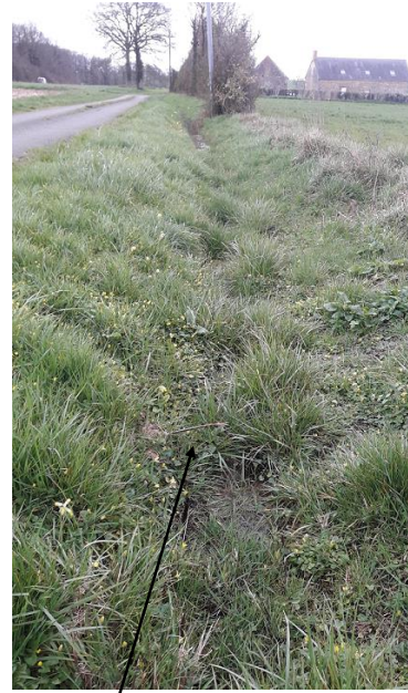
Localisation et vue du tronçon proposé au déclassement