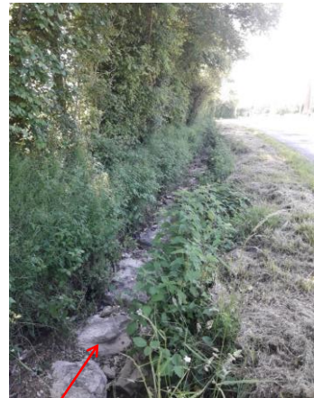
Localisation et vue du tronçon expertisé