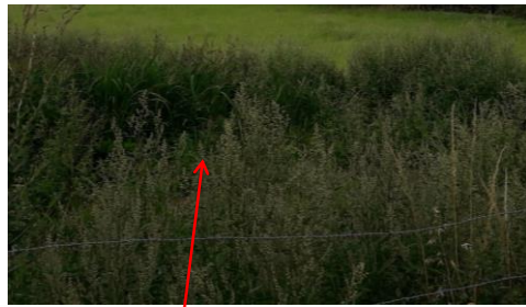
Localisation et vue du fossé de Chasseboulière