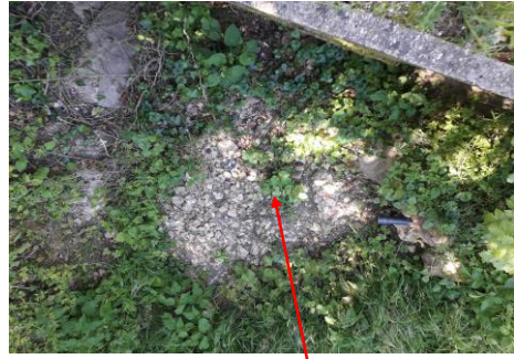
Localisation et vue de l'écoulement du "Court s'il Pleut"