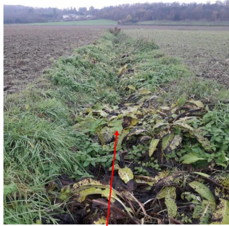
Localisation et vue du tronçon déclassé