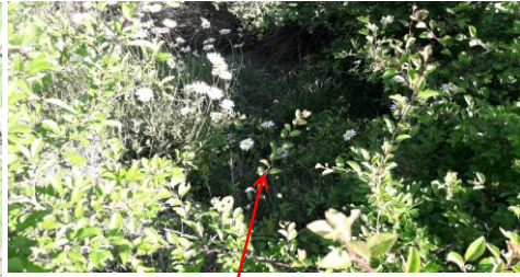
localisation et vue du tronçon du Grand Gagné