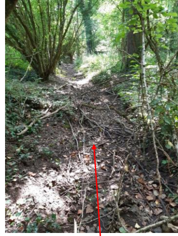
Localisation et vue du tronçon de Grueau