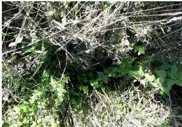
Localisation et vue de l'écoulement expertisé