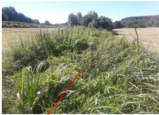
Localisation et vue de l'écoulement de l'Isle