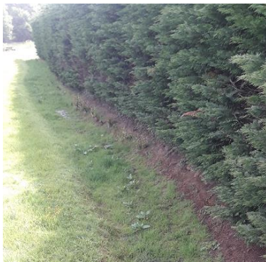
Localistion et vue du tronçon proposé au déclassement