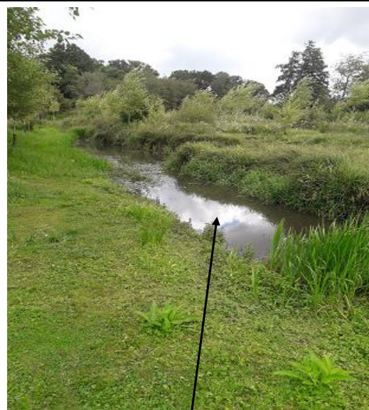
Localisation du tronçon expertisé et vue de la portion restant classée en cours d'eau