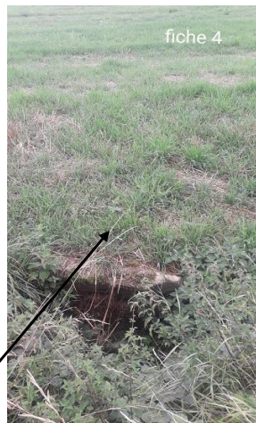
Localisation et vue du tronçon expertisé