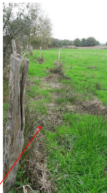
Localisation et vue de l'écoulement de la Potinière