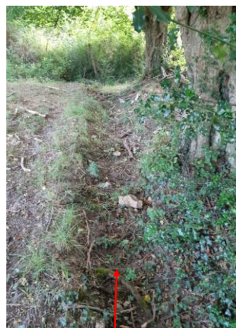
Localisation et vue du tronçon de la Petite Bussonnière