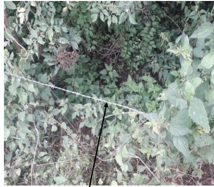
Localisation et vue de l'écoulement expertisé