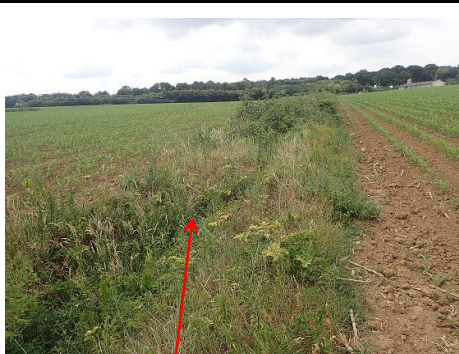
Localisation et vue du tronçon de la Sansonnière