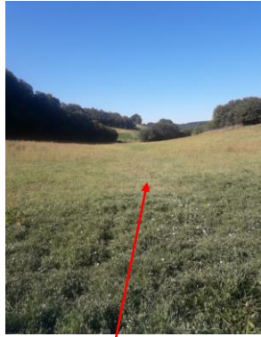
Localisation et vue de l'écoulement de la Tuffière