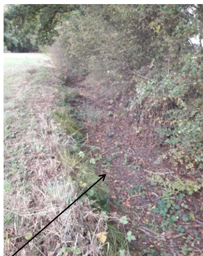
Localisation et vue de l'écoulement des Loges