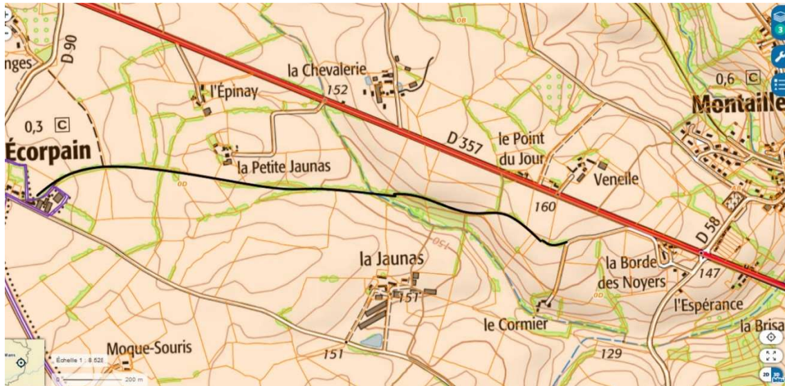
En noir le CR 2 qui part du bourg d'Ecorpain pour arriver à la VC 103 entre le Cormier et la Borde des Noyers.

L'objet de la présente observation est la sécurisation des accès de ces deux itinéraires cyclistes ou piétonniers au bourg de Montaille. Le premier itinéraire arrive par la D58 P, le deuxième par la VC 203 : dans les deux cas, le piéton ou le cycliste, s'il n'en est pas dissuadé, pourrait passer par le carrefour giratoire envisagé ce qui constituerait une mise en danger pour l'un comme pour l'autre en particulier à cause de la présence de très nombreux poids lourds.