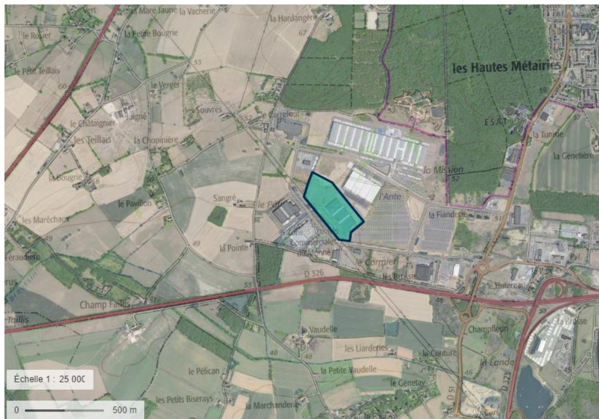
Localisation du projet sur vue aérienne