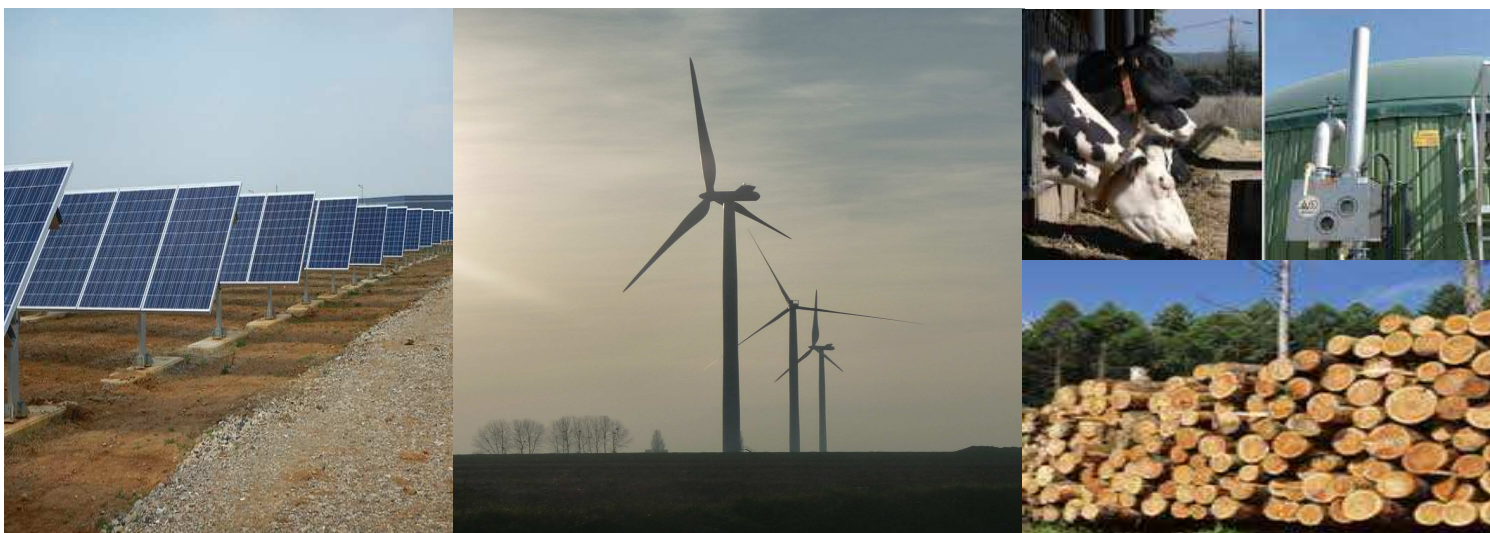
Tableau de bord des énergies renouvelables en Sarthe

Direction départementale des territoires